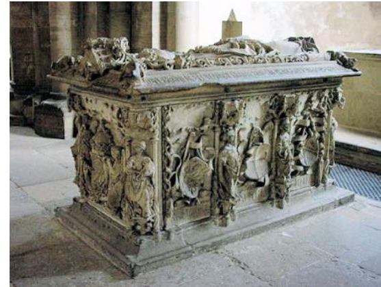
Grab von Editha im Magdeburger Dom

Otto der I. gründete im Jahr 937 das St. Mauritius Kloster, wie der Name schon sagt, zu Ehren von St. Mauritius. Ab dem Jahr 955 ließ Otto die Kirche erweitern und 986 bestimmte er diese zur Kathedrale. Eine Kathedrale ist eine kunstvoll gestaltete Kirche in dem ein Bischof über ein sogenanntes Bistum (ein Bistum ist ein Gebiet in dem ein Bischof herrscht und das Gebiet verwaltet) herrscht. So ein Bistum errichtete Otto in den 950er Jahren - nur als Erzbistum (ein Erzbistum ist das gleiche wie ein Bistum, nur das ein Erzbischof über dieses Gebiet herrscht und es verwaltet). Für dieses Erzbistum bekam Magdeburg sogar eine Urkunde! Original unterschrieben von Otto I. steht sie nun im Stadtarchiv Magdeburg. Ebenfalls in den 950er Jahren begann Otto den großen Neubau des Doms. Für diesen ließ er viele kostbare Materialien nach Magdeburg bringen. Nachdem der Dom fertig war, starb Otto I. ziemlich bald. Er und seine, schon früher gestorbene, erste Frau Editha ließen sich in der St. Mauritius Kathedrale bestatten. Am 20.05.1207 wurde der Dom durch einen Dorfbrand zerstört. Ebenfalls 1207 wurden die Ruinen des Doms abgerissen und Albrecht I. von Käferburg legte den Grundstein unseres heutigen und damit dritten Doms in der Geschichte.