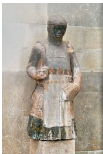
Der heilige Mauritius im Magdeburger Dom mit einem Reichsschwert in der Hand.

Der heilige Mauritius war der Legende nach Anführer von der sogenannten Thebaischen Legion. Die Thebaische Legion war eine römische Armee, welche die katholische Kirche beschützt hat. Alle Mitglieder dieser Legion wurden höchst verehrt. Der Legende nach, mussten sie jedoch den Märtyrertod erleiden, das bedeutet, dass sie sich so sehr für ihren Glauben eingesetzt hatten, dass sie von Menschen, die nicht derselben Ansicht waren wie sie, getötet wurden. Diese Legende war im Mittelalter sehr berühmt. Doch nun zurück zu Mauritius. Mauritius wurde seit dem 4. Jahrhundert als Heiliger verehrt. Sein evangelischer und römisch-katholischer Gedenktag ist der 22. September. Mauritius wurde angeblich bei Theben in Ägypten geboren und ca. im Jahr 290 in Agaunum im Wallis gestorben sein. Dies war eine Gemeinde in der heutigen Schweiz. Dieser Ort wird heute als Saint-Maurice VS bezeichnet. Auf den heiligen Mauritius werden das Reichsschwert, die heilige Lanze und Teile der Reichskleinodien (anderes Wort für Insignien) zurückgeführt.