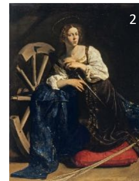
St. Mauritius und Katharina von Alexandrien