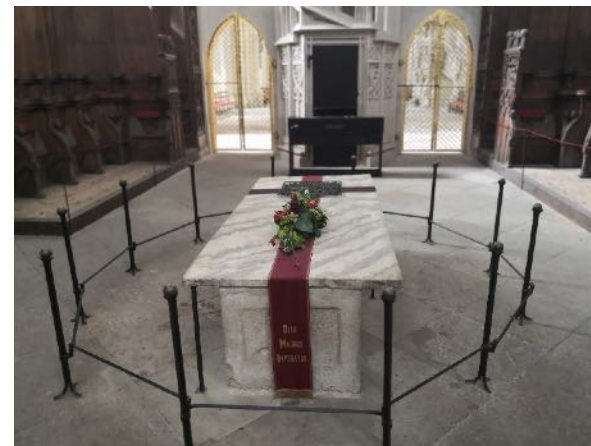
Grab von Otto I. im Magdeburger Dom